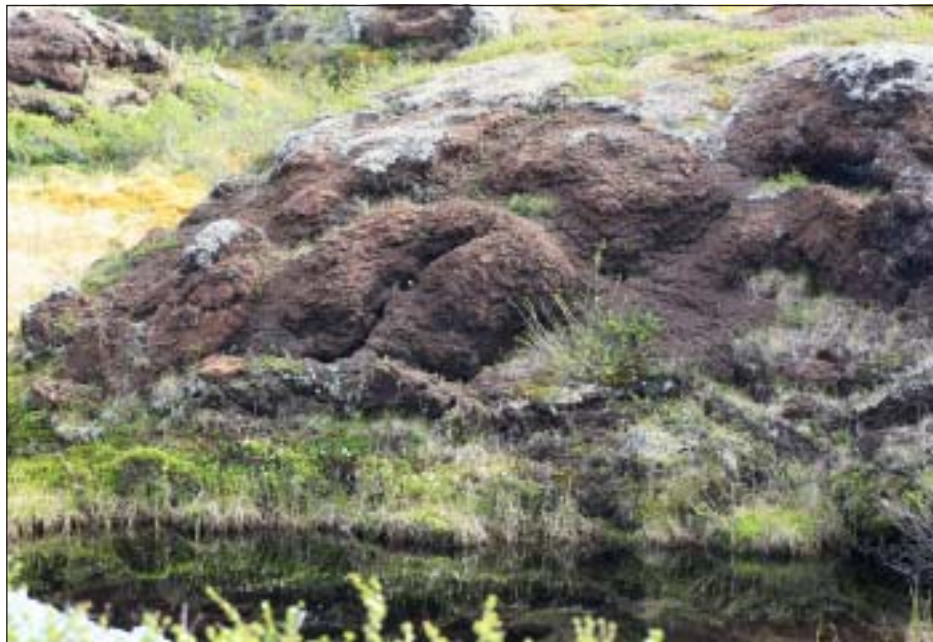
Pals i Taavavuoma. Den här var cirka fem meter hög. Framför palsen ser man palslaggen.

östliga delen är mycket fågelrik med en rad arter av både änder och vadare.