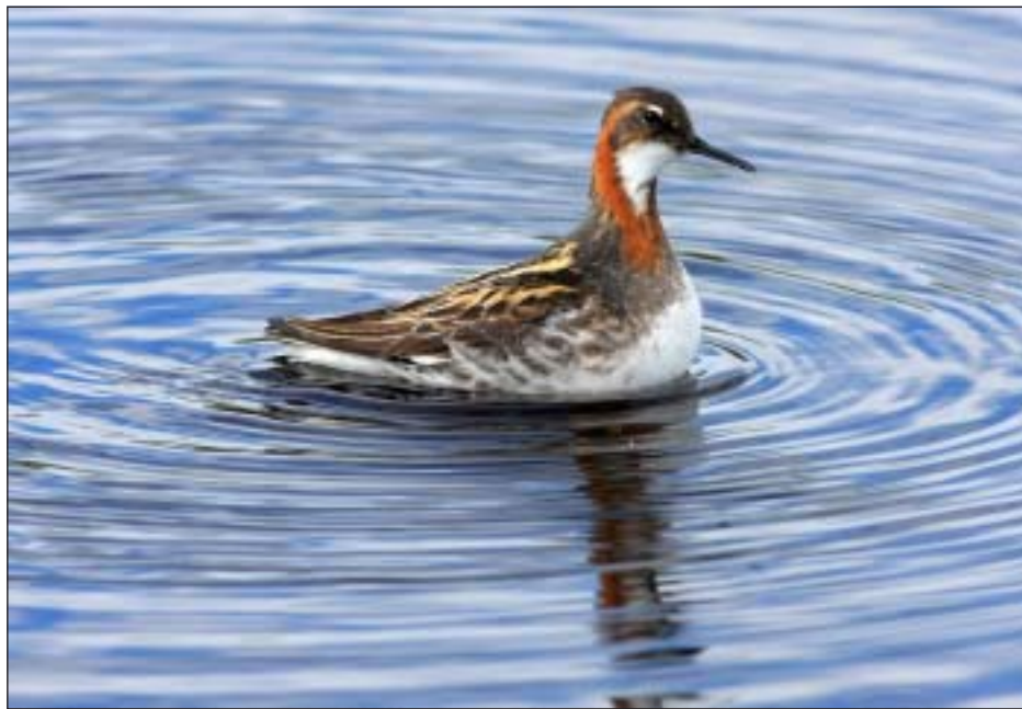
Smalnäbbad simsnäppa var mycket vanlig i området.

Problemen med skavsåren på fötterna gjorde sig mer och mer påmind. Det var svårt att komma igång och gå efter de pauser som jag gjorde. Till slut så kom jag ned till det ställe där Jeutojåkk rinner ut i Taavaätno och de värsta videområdena var passerade. Jag tog en lång paus innan jag fortsatte de sista fem kilometrarna, för jag var ganska mör. När jag vid halv åtta-tiden på kvällen kom fram till tältet var jag rejält slitna efter ett tolvtimmars pass på myr och i vide. Dessutom var det ingen vacker syn när jag tog av mig stövlarna och betraktade de skavsår som fanns både på stor- och lilltår på båda fötterna, fast högra var värst. Tydligt var stövlarna alldeles för smala.