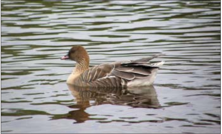
Ovan: Spetsbergsgås, Lillfjärden augusti 2009: Foto Mats Åberg.