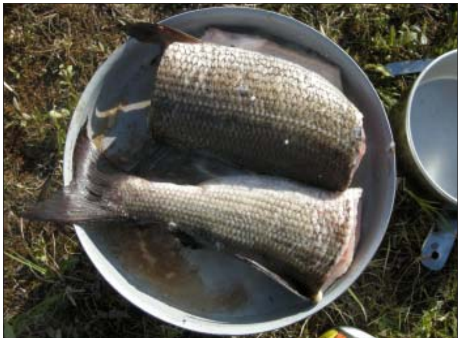
Stekt nyupptagen harr till middag smakade utsökt.

finska fisketidningar och fiskesajter måste ha skrivit mycket gott om fisket i "Sandsålandet" Efter att ha följt jokken ned till sammanflödet med Råstoättno och bildandet av Lainioälven återvände vi till tältet vid lunchtid.