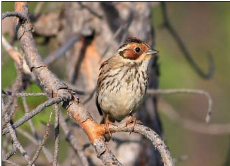
En av de tre dvärgsparvarna från Äihämjärvi i juni 2009.