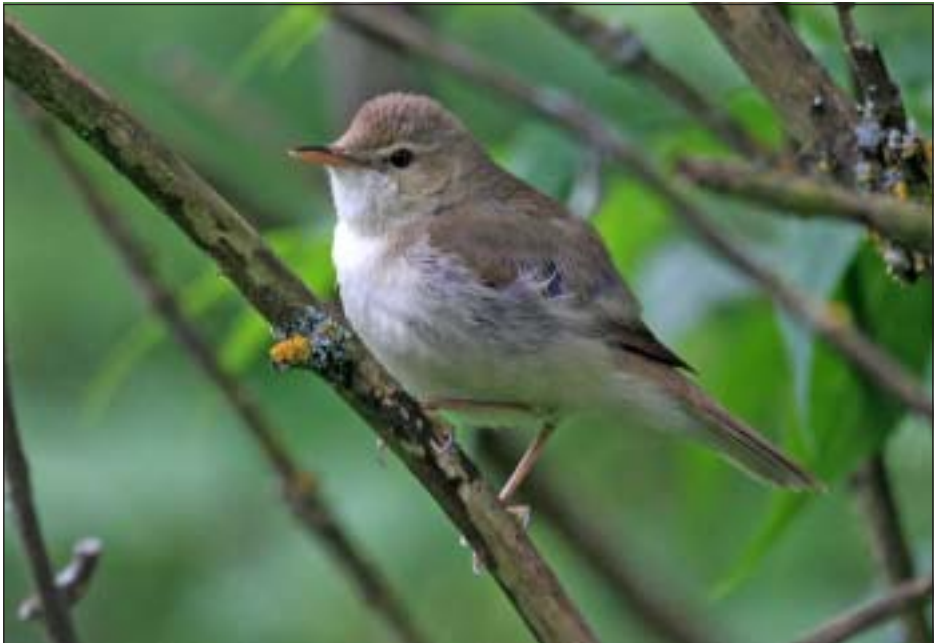
Nedan: Den busksångare som sjöng vid Delsbo kyrka i juni 2009.