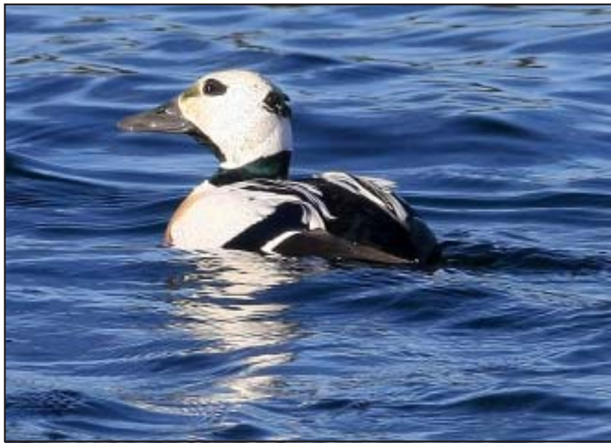
Hanen alförrädare vid Kuggören i februari 2009.