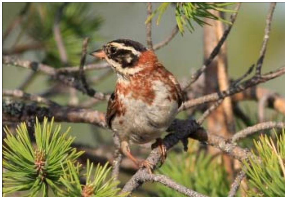
Hane av videsparv från ett av de två paren i Äihämjärvi.

Sydstasien norrut till nordöstra Kina. Första observationen i Sverige gjordes 1815 i Lund, Skåne. Det första boet hittades vid Vittangjärvi, norr om Kiruna, 1952. Från början av 1960-talet har dvärgsparven varit årlig i landet. I början gjordes nästan enbart observationer i södra Sverige men från mitten av 1960-talet har sparven varit årsviss i Norrland. Just 1965 gjordes den första observationen vid Luspebryggan, Lule lappmark under många år en pålitlig lokal med som mest upp till 11 sjungande hanar (1965) och flera konstaterade eller misslyckade häckningar. Antalet dvärgsparvar har dock minskat i området och ett par år på 2000-talet har ingen dvärgsparv alls rapporterats. I år har dock tre fåglar hörts och setts kring Luspebryggan. Förutom de tre sjungande fåglarna i Äihämjärvi har i år cirka tio dvärgsparvar rapporterats från nordligaste Sverige.