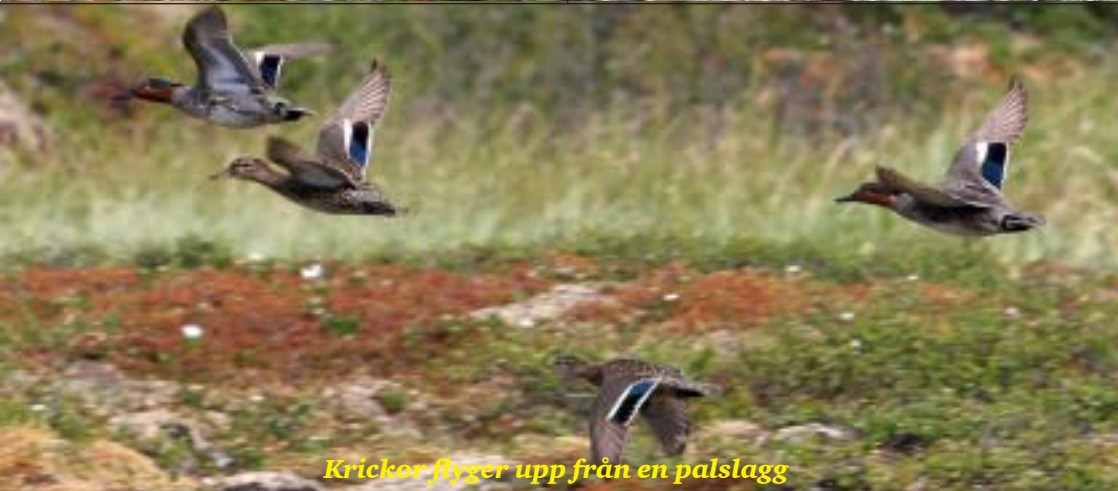
Krickor flyger upp från en palslagg