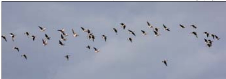
Ungefär hälften av de 100 fjällgäss som nu rastar här.

Det har alltså fötts tekordmånga ungar. Detta ett år när det i princip inte finns en gnagare vilket brukar påverka alla häckande fåglar. Predationen från rovdjur blir större sådana år. Fantastiskt att få se denna mängd fjällgäss.