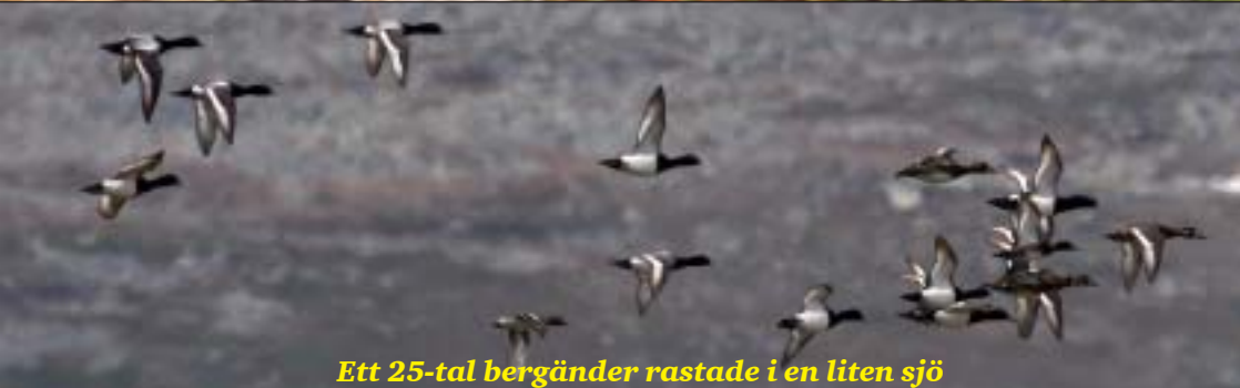
Ett 25-tal bergänder rastade i en liten sjö