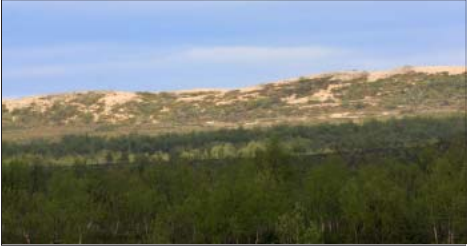
Leden från Pulsujärvi går på Vuomapuoltjah:s sandåsar. Mycket lättgått.