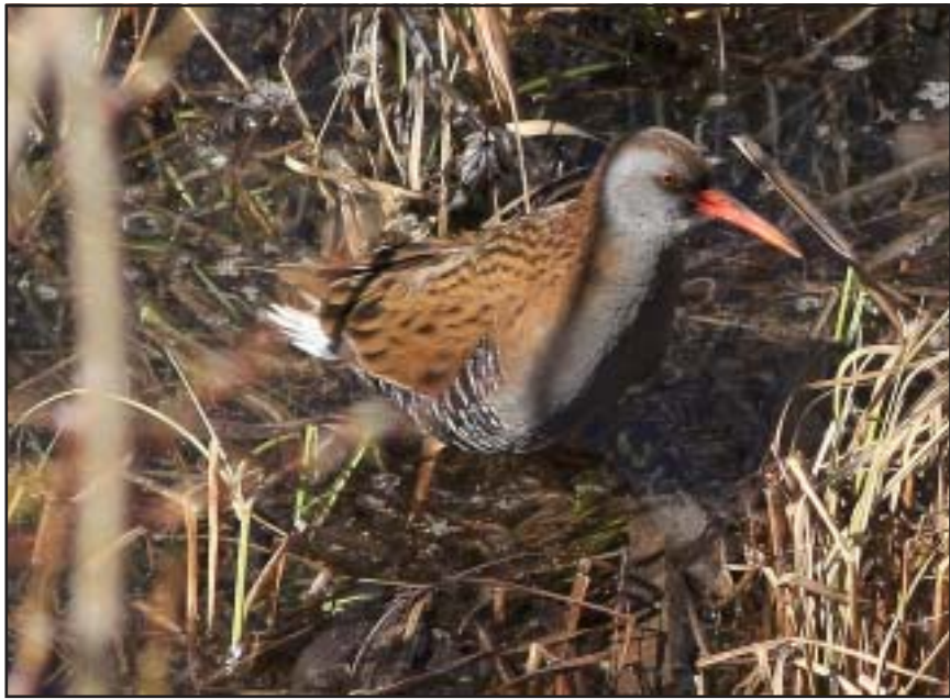
Vattennall i Tunasjön april 2009, Foto: Lars-Göran Lindström.