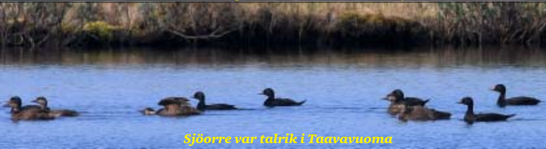
Sjöorre var talrik i Taavavuoma