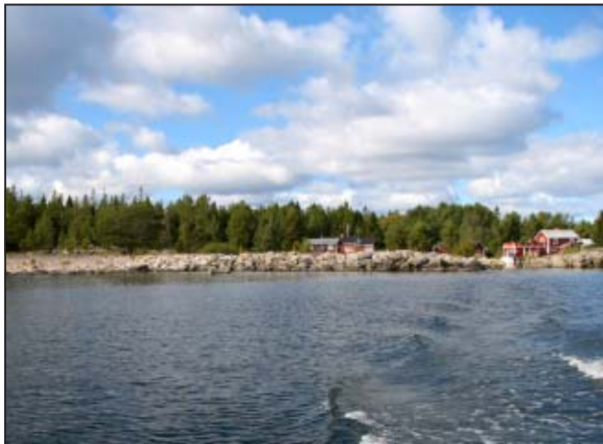
På väg in i hamnen på Gran.