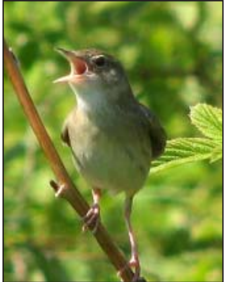
Till vänster en av kärresångarna på Gammelbansvägen. Till höger en av gräshoppsångarna i Jättendal juni 2007.