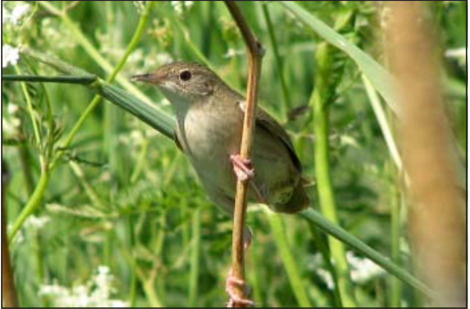
En av de två gräshoppsångarna i Jättendal juni 2007.