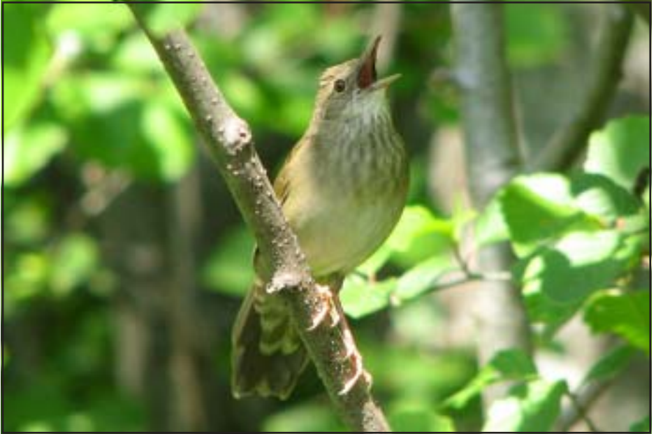
Flodsångaren i Åkne, Gnarp juni 2007.