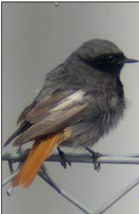
Hanan i paret av svart rödstjärt som häckade vid Håstaholmen.

Sensommaren bjöd på fina observationer av artiska vadare. Många sågs ute i skärgården i mitten av juli och senare sågs även en och annan vid Hålsjöviken och Svågans mynning. Den bästa lokalen var dock Kyrksjön, Harmånger där bland annat spovsnäppa, småsnäppa, kustpipare och smalnäbbad simsnäppa sågs bland mängder av vadare. Ett fåtal bändelkorsnäbbar i slutet av juli indikerade på att det kunde bli en invasion av arten, men den tycktes snabbt komma av sig. Augusti bjöd annars på tillfälliga observationer av de rara rovfågelarterna röd glada (Svågadalen) och aftonfalk (Rogsta).