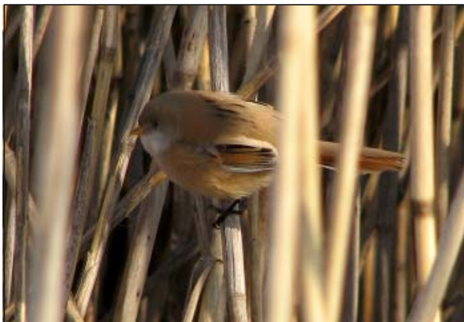
Hona av skägges. Hålsjöviken mars 2007.