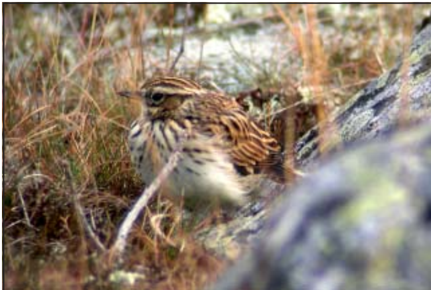
Trädvärka, Höllick september 2007.