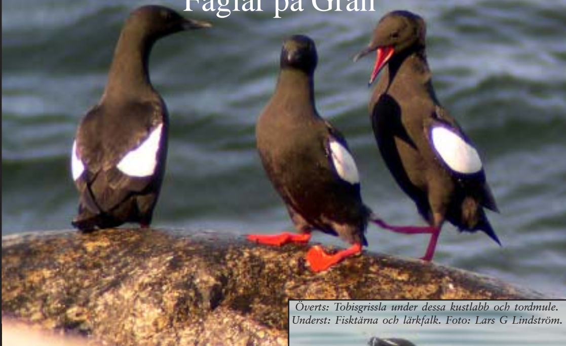
Övert: Tobisgrissla under dessa kustlabb och tordmule. Underst: Fisktärna och lärkfalk.