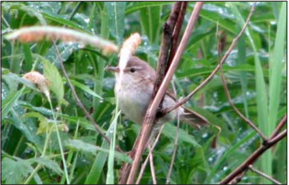
Busksångaren på Reffelmansviken juni 2007.