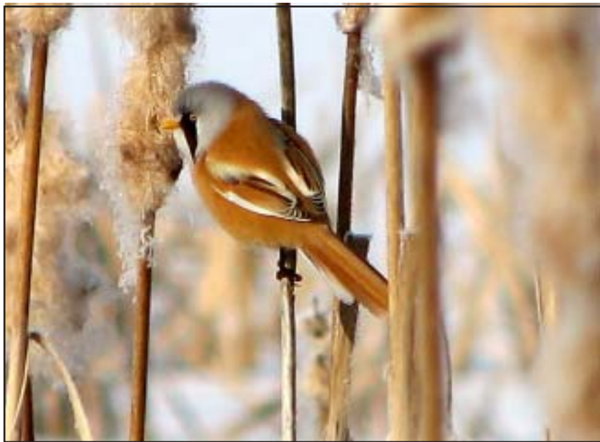
Hane av skäggmese. Hålsjövikens mars 2007.