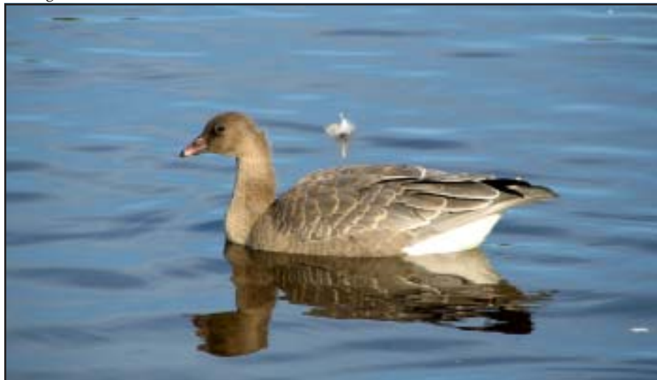
Juvenil spetsbergsgås i Lillfjärden, september 2005.

Det kan tyckas vara långt till april men tiden går fort och i alla fall startar den populäraste aktiviteten den 11:e. Mer information kommer i nästa nummer.