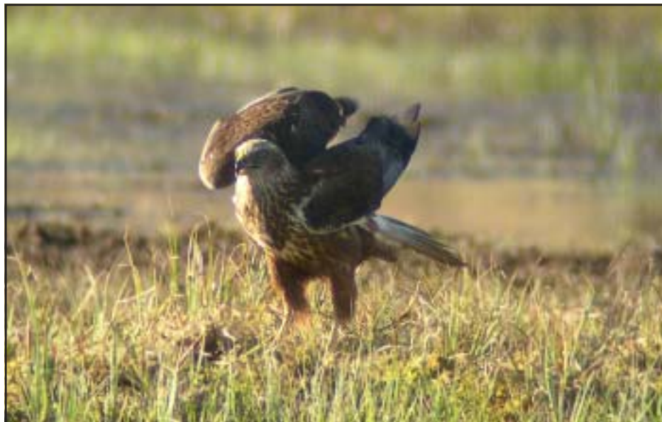
Brun kärrhök i Tunasjön.

Bergand var den art som alla ville se och efter en stund hittade vi fem stycken. Tyvärr låg de ganska långt ut så några kanonobsar på bergänderna blev det inte. När vi skådat klart vid Malgrynnan delades gruppen upp i två mindre. "Kryssarna" åkte till Myra i Delsbo där det tidigare under dagen observerats två raphhöns. Raphhöna är en mycket ovanlig fågel i Hälsingland, och för oss skulle det bli en ny Hälsingart. Vi hade tur och fick se raphhönsen riktigt bra, även om de stundtals tryckte hårt ute på sin stubbåker. Från Delsbo vidare till Hålsjövikén. Där sammanstrålade vi med den andra delen av gruppen, som hade tagit sig till Hålsjövikén via Hög och Näsvisken. Gråhakedoppingarna var fullt upptagna med bobygge. Ett par hade valt att placera sitt bo alldeles nedanför fågeltornet. För att inte störa doppingarna alltför mycket stannade vi därför uppe i tornet bara en kort stund. Övriga observationer vid Hålsjövikén var cirka 60 rastande