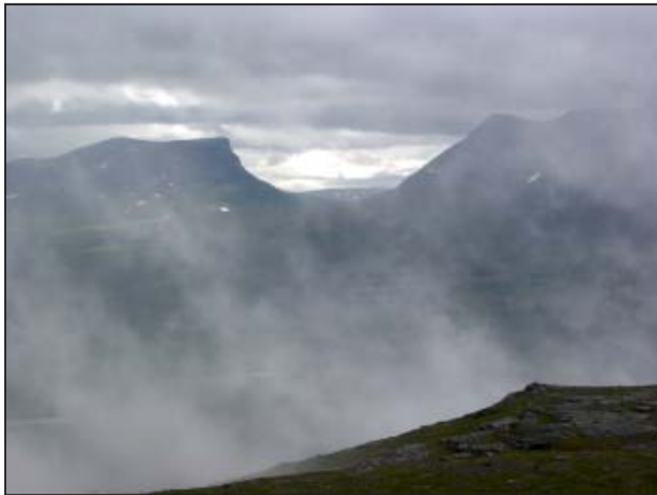
Utsikt från Nuolja mot Lappporten. Juli 2005.

oändeliga följd av riken. Här spelar fjärrvärldens blå, med ton för ton, med klarhet, slocknande i disens skärhet. Som tecknade i en bristande dröm mot vitblå rymden, torna sig sylar och tinnar, med snö, vars renhet strålar ut i allt.