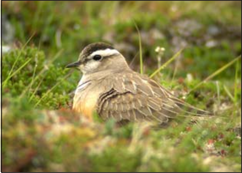
Fjällpipare på Nuolja, juli 2005.