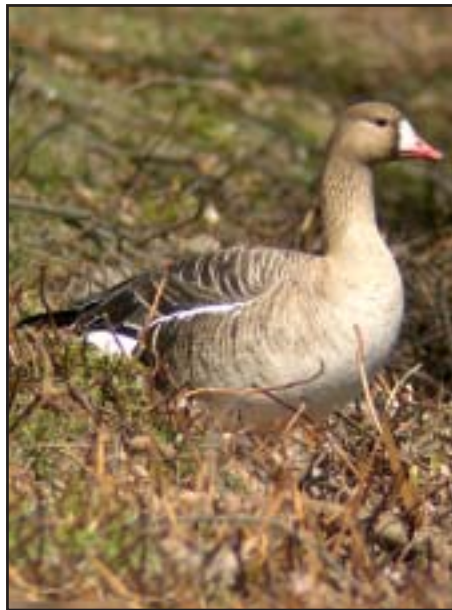
Bläsgås vid Lillfjärden i maj 2005.

Bland alla gässen runt Hudiksvall hittades under sommarens lopp många olika arter.