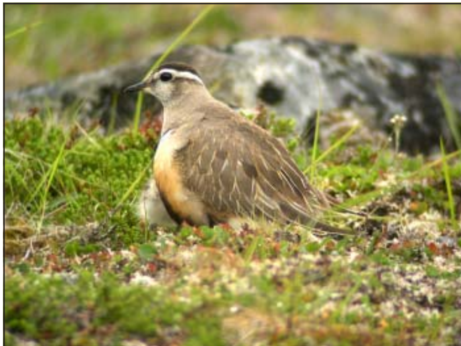
Fjällpiparhannen på Nuolja sommaren 2005. Observera ungen till vänster som är på väg att söka skydd under hanen.

”Åren hade runnit, och jag längtade att se honom åter. Där låg en bergskoloss och skrämde i den tunga dagern. Dess mörka molnblå var en överväldigande grusksamhet, och snöfälten breddes som svepningstäckan. På närhåll, väl däruppe, blev allting tryggt och vänligt. Och nu var himlen strålande och ren.