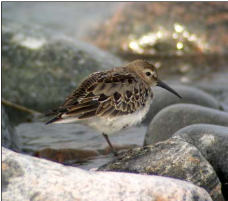
Ung kärrensnäppa rastande på Gran i September 2004.