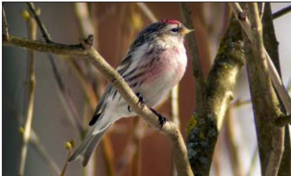
Gammal hane av gråsiska. Foto: Lars G Lindström, Håstaby mars 2004.