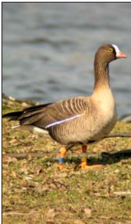
En av de få fjällgäss, av de fåglar som rastar hos oss, som numera är märkta. Denna fågel har nummer 093 (gul, vit, blå) och är en hane född 1995. Denna bild togs nu i höstas i Lillfjärden. För första gången var inte partnern 059 med.

med, nu mot Azerbadjan. Tio dagar senare befanns sig fågeln i östra Turkiet för att slutligen i slutet av november nå sina övervintringsquarter i Irak. Sedan dess har fågeln bytt rastställe flera gånger. Nu senast (26:e januari) befann den sig tio mil sydost om Bagdad nära floden Eufkrat. Vi får hoppas att fågeln överlever och att sändaren fungerar när flytten mot häckningsområdena startar. Om ni är intresserade, gå då in på http://www.piskulka.net/Satellite%20tracking.htm . Nya rapporter kommer var sjätte dag.