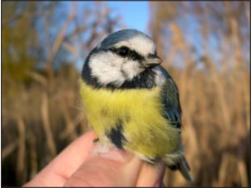
Blåmes blir ringmärkt.