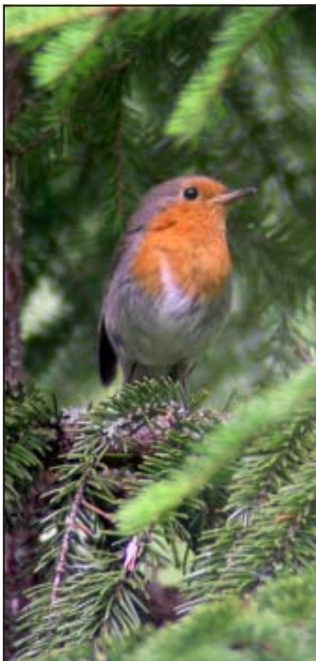
Rödhakesångaren med sitt röda bröst. Foto: Lars G Lindström, augusti 2004.

Fåglarna kom en gång sams om att välja en kung. De beslöt att den som kunde flyga högst