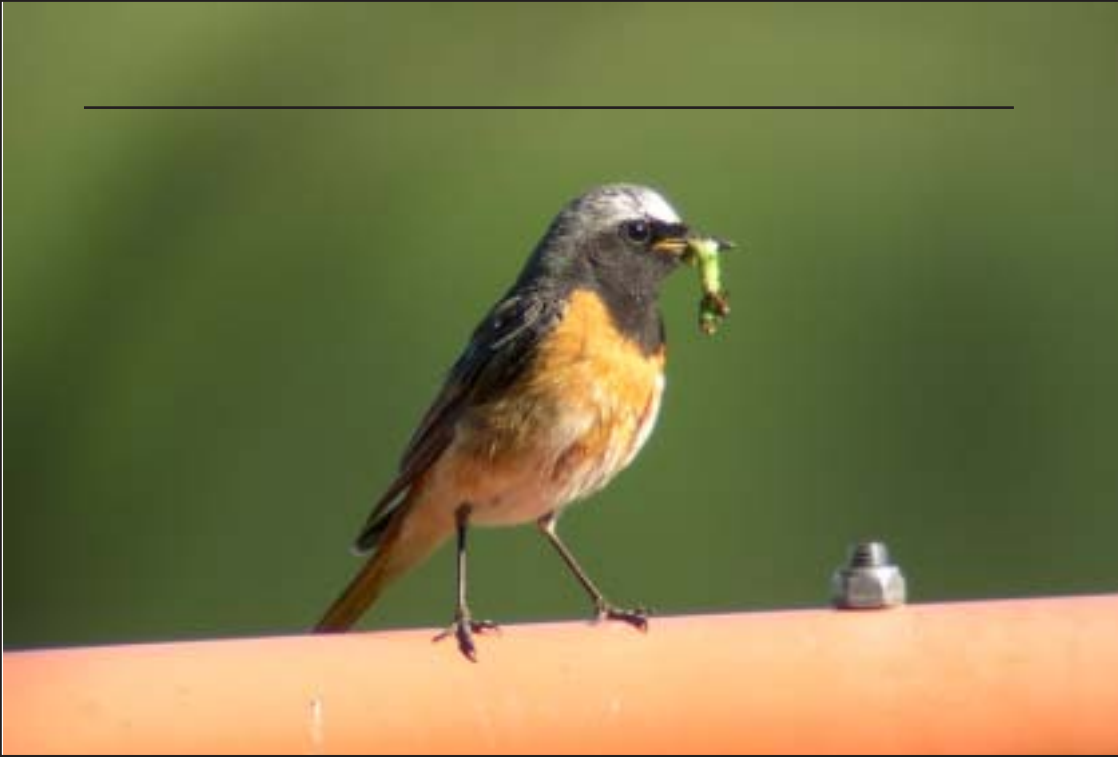
Two summer species. Above, redstart. Below, goshawk.