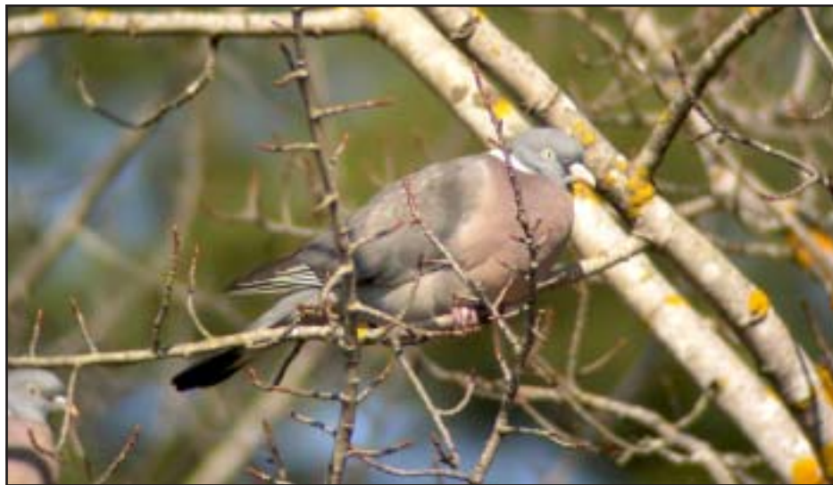
Ringduva sågs i januari. Denna fågel knäpptes dock inte då.