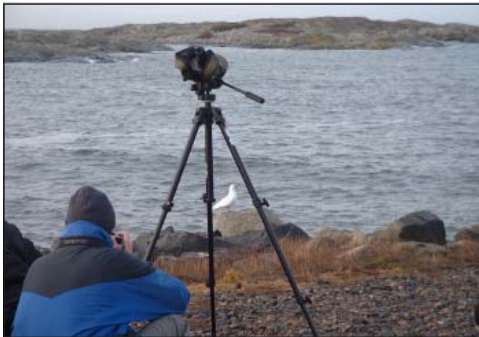
Ismåsen var som synes inte speciellt skygg. Lerkil, december 2004.

Efter en dryg timmes tid, när alla sett sig mätta på ismåsen, åkte vi vidare norrut längs kusten. Vid Stora Amundön stannade vi för att leta efter två svartnäbbade islommar. Vi lyckades inte hitta några islommar, utan åkte istället vidare in till Göteborg. Där hade vi bättre tur och fick efter någon timme se den svarthuvad mås som höll till i Göta älv vid Älvsborgsbrons fäste. Dagen därpå skådade vi vid Glommens hamn och Getterön, där vi bland mycket annat fick se tretåig mås och havssula. Vid tvåtiden på eftermiddagen var det dags att åka hemåt. Alla var naturligtvis mycket nöjda med resan, den kritvita ismåsen kommer vi att minnas länge.