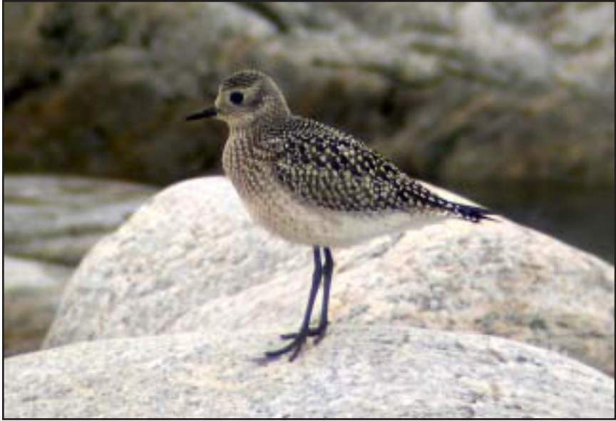
Kustpipare. Gran, september 2004.