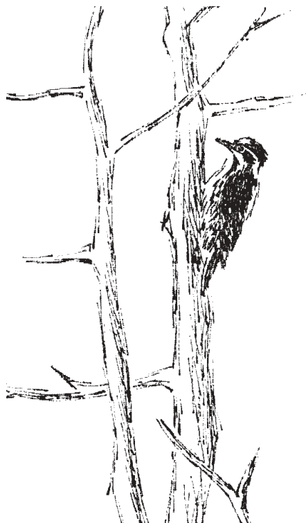
Tretåig hackspett häckar på Gran.

Långtidsprognoserna? visar att i andra halvan av maj så kommer varma vindar att blåsa från sydost. Med andra ord perfekta förhållanden för att många av nattsångarna från de baltiska staterna skall förlänga sin flyttning och dyka upp hos oss. Mer behövs inte sägas.