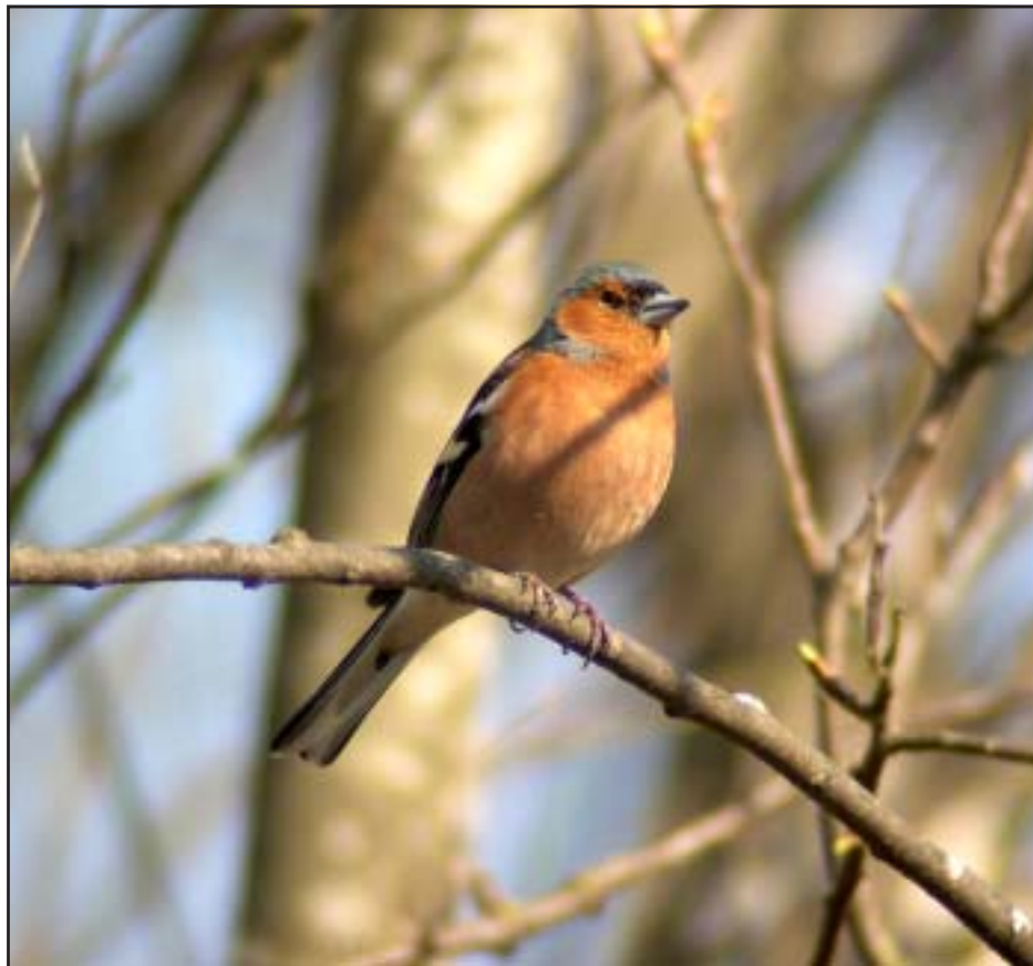
Bofink sågs den första januari. Denna fågel knäpptes dock inte då.

vi stannade för att kolla in dessa och bland mesarna upptäcktes en mindre hackspett. Öväntat och kul. Framme i Hölick började vi med att gå in på campingområdet där några av husvagnsägarna har satt upp talgbollar och fröautomater. Det dröjde inte länge förrän vi hittat tre nya arter, svartmes, tofsmes och trädkrypore. Nu gällde det att skynda sig ut till havet. Efter en stunds ivrigt spanande ut över ett blåsigt hav lyckades vi hitta både en flock alfåglar samt fyra stycken småskrakar. Därmed var det nya rekordet ett faktum, vi