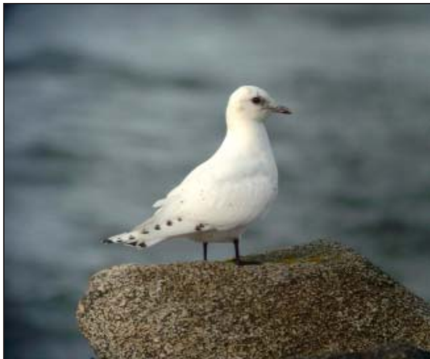
Ismås, Lerkil december 2004.